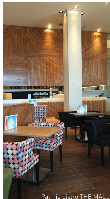
Palmie bistro THE MALL