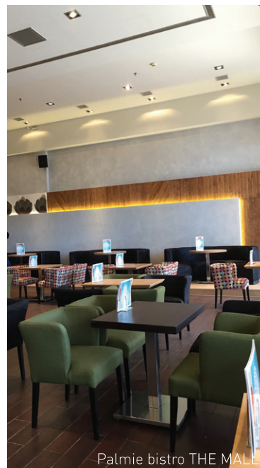
Palmie bistro THE MALL